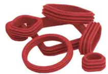
"interfacial" seals joints interfaciaux