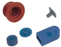
various and "micro" parts divers et petites pièces