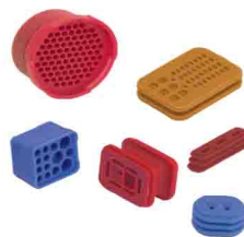
"grommets" joints multifilaires