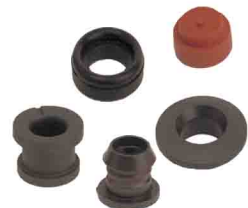
various seals joints divers