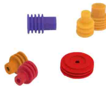
"one way" seals joints unifilaires