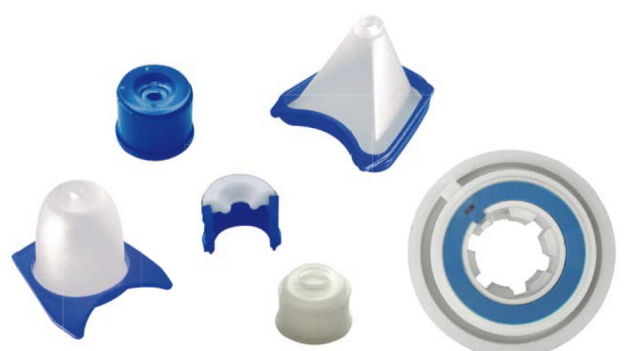
2 components parts sous-ensembles bi-matière