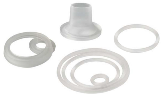
specific seals étanchéité spécifique